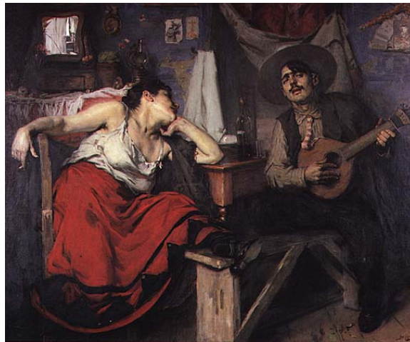
José Malhoa, 1910